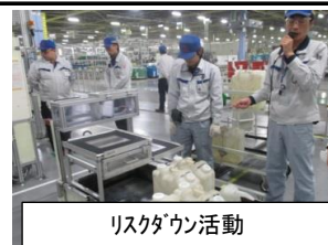
リスクダウン活動