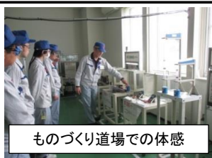
ものづくり道場での体感