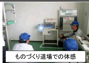
ものづくり道場での体感