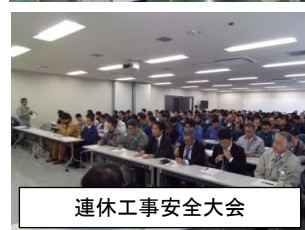
連休工事安全大会