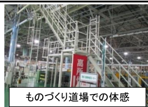
ものづくり道場での体感